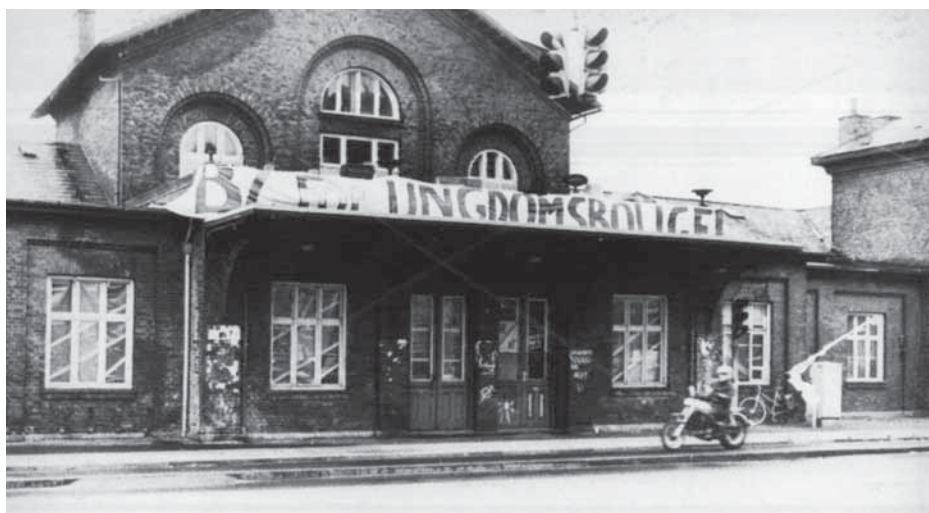
Østbanegården, 1982. I september 1979 besatte Boligkaravanen Østbanegården og blev ved en større politiaktion sat ud af den besatte ejendom. Aktionen fik en særlig status i anarkistkredse og inspirerede den senere BZ-bevægelse, som den 11. oktober 1982 besatte bygningen på ny.

derfor satte sig for at kollektivisere bolignøden. Når politiet ankom, forlod gruppen igen stedet. I september 1979 besatte gruppen Østbanegården og blev ved en større politiaktion sat ud af den besatte ejendom. Under aktionen blev næsten et dusin anholdt og flere bidt af politihunde. En af personerne fra den snævrere kreds klagede sammen med flere andre over politiet, og det kom til en offentlig undersøgelse. Boligkaravanen stoppede i 1979 – gik i ”vinterhi” – bl.a. som følge af, at flere fra karavanen flyttede sammen i bofællesskaber og kollektiver. Ud af denne kreds af aktivister udkrystalliseredes den centrale anarkistgruppe på fire personer, som skulle blive til Statsfjenderne. 87 Udtrykket den centrale anarkistgruppe er Kommissionens og vil blive anvendt nedenfor.