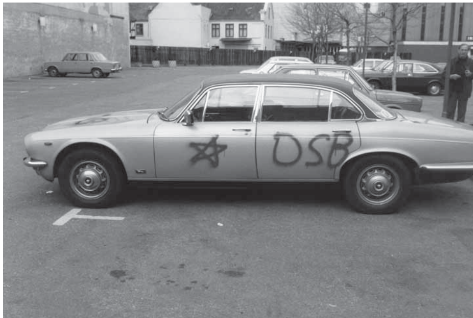
Hærværk forøvet af DSB ved påmaling af Jaguar parkeret på Åboulevarden den 1. maj 1980.